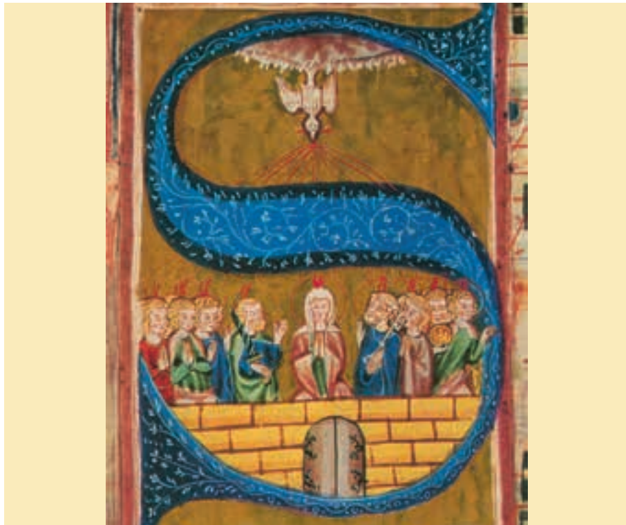
Pfingsten, Initiale, Wonnental/Breisgau, um 1350

Maria ist zugleich die Kirche, die Gemeinschaft der Glaubenden, die Mitte, der alle Ämter und Dienste (auch Petrus mit dem Schlüssel) zugeordnet sind.