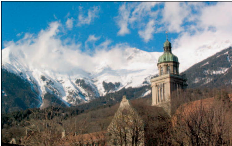
Canisianum – im Hintergrund die Nordkette

im Obdachlosenheim „Vinzines“, die Praktika im Krankenhaus bzw. im Alten- und Pflegeheim und die Unterstützung des Straßenkinder-Projektes der Salesianer in Quito. ■